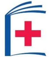
BỆNH VIỆN ĐẠI HỌC Y HÀ NỘI